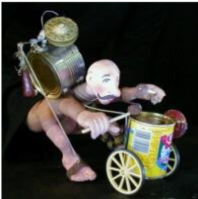
Mano Viva van Girovago e Rondella